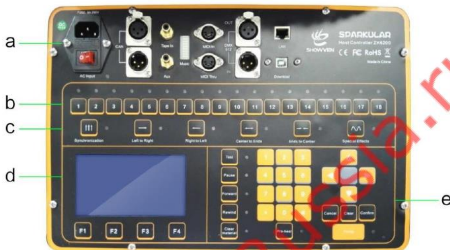
Панель Управления DMX Контроллера