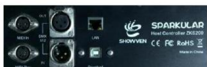
DMX Контроллер (ZK6200)